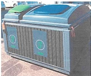
Nadzemni kontejner od 2m 3