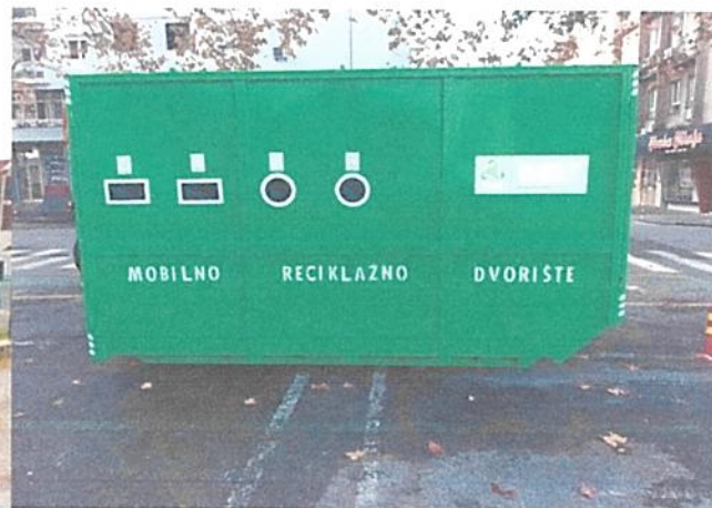
Slika 2. Mobilno reciklažno dvorište

S obzirom da su tokom ove, kao i prethodnih godina, već ostvareni određeni prihodi po osnovu plasmana sakupljenih količina prvenstveno reciklabilnih materijala, planirano je da se i tokom 2023. godine nastoji povećati nivo ovih prihoda, kako bi se u dogledno vrijeme stekli uslovi da ovi komunalni objekti budu djelimično ekonomski samoodrživi.