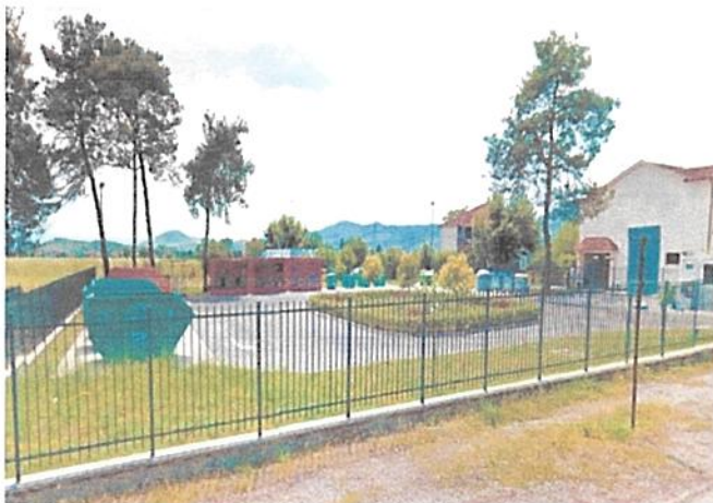
Slika 1. Reciklažno dvorište