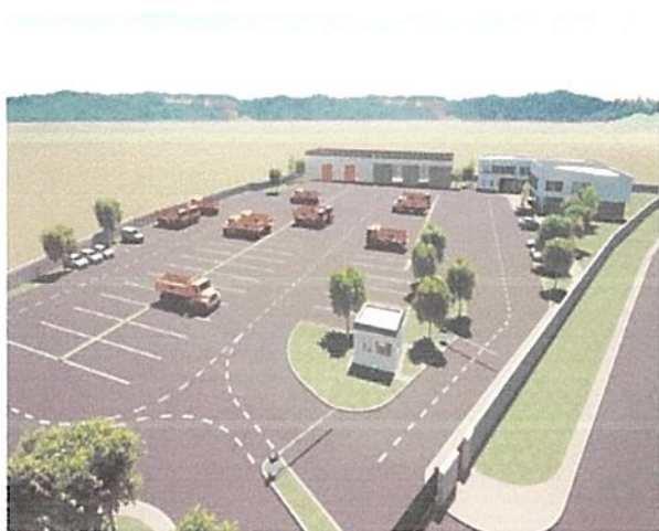
Digitalni prikaz novog kompleksa