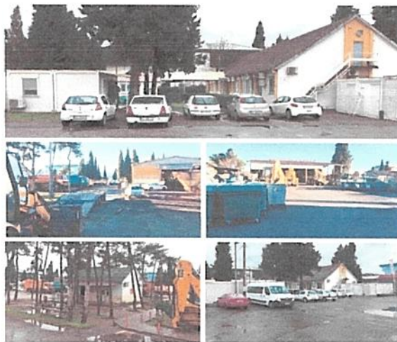
Postojeće stanje upravne zgrade sa pratećim objektima

Tokom 2022. godine urađeno je Idejno rješenje novog kompleksa, za koje je dobijena Saglasnost Glavnog gradskog arhitekta. Takođe, sprovedene su tehničke radnje koje se odnose na geodetsko snimanje lokacije, kao i prikupljanje tehničke dokumentacije, neophodne za stvaranje uslova za izradu Glavnog projekta i početka izvođenja radova na ovom lokalitetu.