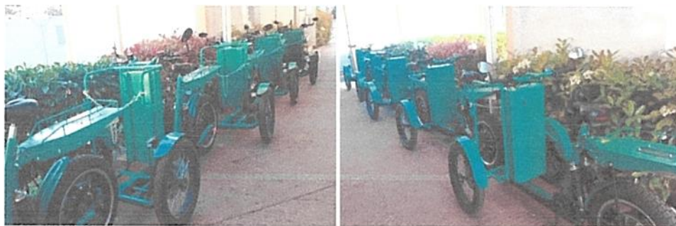
Električna teretna trokolica