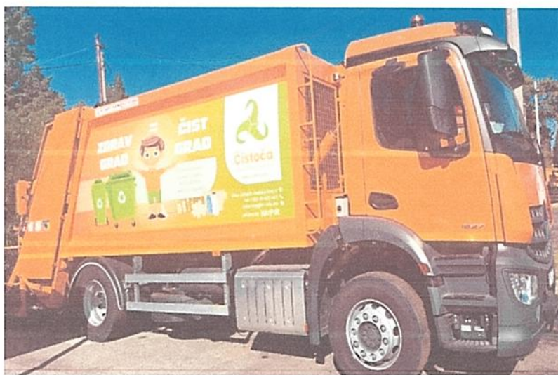
Autosmečar 16 m 3

Planirano širenje urbanih prostora i zahvatanje preostalih ruralnih područja za odlaganje i odvoz komunalnog otpada sa područja Glavnog grada, uz već postojeće obaveze, prirodom posla, zahtijeva dodatna sredstva i opremu, a što je uslov poboljšanja rada na sakupljanju i transportu komunalnog otpada, zaštite i očuvanja zdrave životne sredine, dakle realizacije postojećih i novoformiranih obaveza tokom 2023. godine.